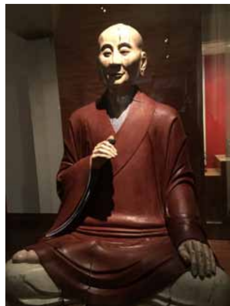
Magnifique statue du musée des arts asiatiques de Toulon

Don du sang, lundi 27 juin à la salle des Fêtes Marc Baron, de 8 h à 12 h 30.