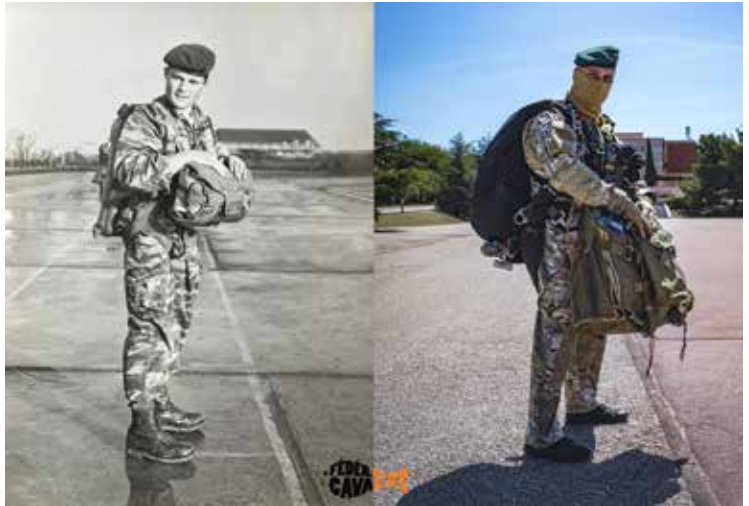
Dans les années 60, le Commando Hubert s'installe définitivement sur le site du Canier à l'Est de la presqu'île, une base qu'il occupe encore aujourd'hui.