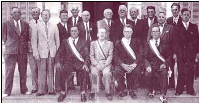
Ci-dessus relaté en quelques dates, le détachement administratif de la commune de Saint-Mandrier, extraits d'ouvrages de Ken Nicolas, que nous remercions vivement.

Malgré un budget restreint, le travail peut commencer au sein des différentes commissions mises en place. Le problème vital pour le village reste l'amélioration de la distribution de l'eau, sans oublier la création d'infrastructures élémentaires (routes, bâtiments administratifs, écoles, sanitaires...) et la continuité de l'effort de reconstruction des sites endommagés pendant la guerre.