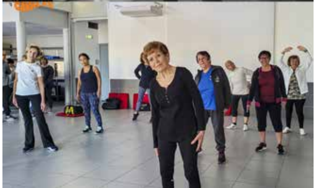
La FÉDÉRATION CAVALAS