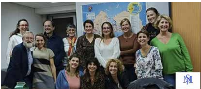
L'équipe de la MAISON DE SANTÉ DE LA PRESQU'ÎLE

La MSP s'engage à améliorer l'accès aux soins et lutter contre les déserts médicaux, tout en offrant un environnement de travail attractif pour les professionnels.